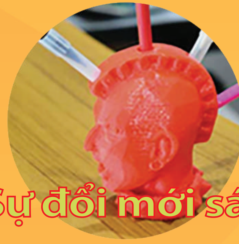
Sự đổi mới sáng tạo